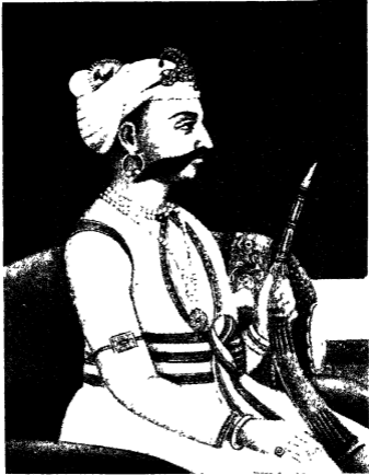
काशी नरेश राजा चेतसिंह